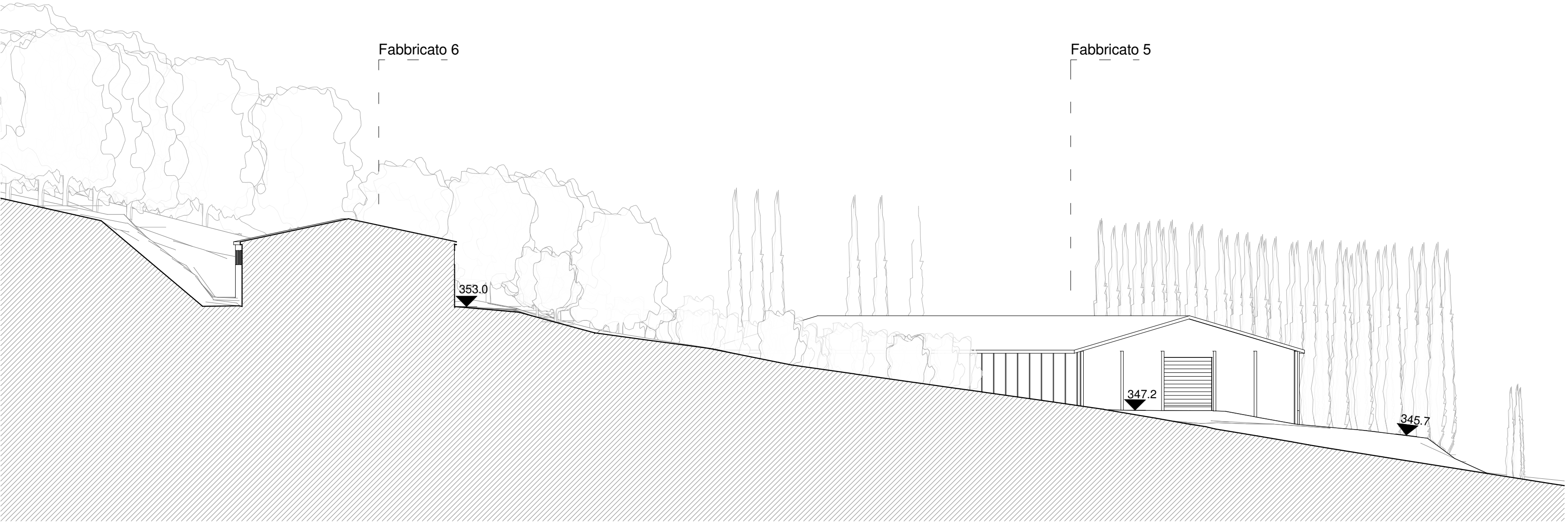
Sezione DD' - Stato di fatto